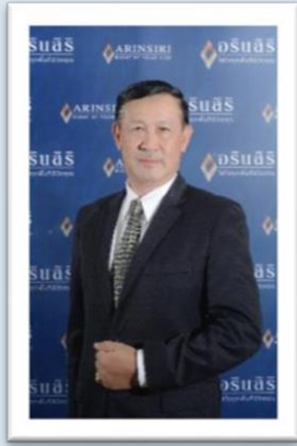
พล.ต.อ.วิรุฬห์ เวี่ยมไฟจิตร